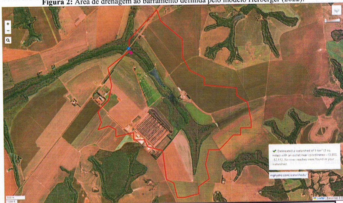
Figura 2: Área de drenagem ao barramento definida pelo modelo Herberger (2022).

Heberger, Mateus. delineator.py : delineamento global rápido e preciso de bacias hidrográficas usando métodos híbridos baseados em vetores e raster. 2022. https://doi.org/10.5281/zenodo.7314287