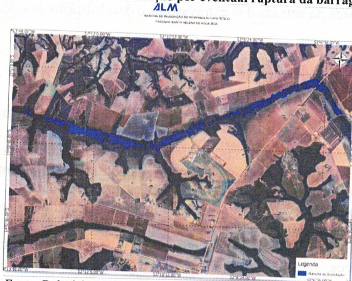
Figura 3: Mancha de inundação por eventual ruptura da barragem.